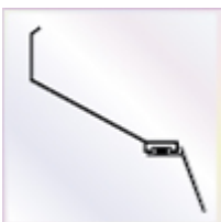
2 Stück a 4500 mm