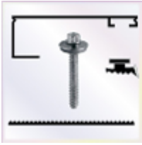
2 Stück a 3500 mm Alu - U - Profil

- einschl. des erforderlichen Tape - Bandes zum Verschließen der Stirnseite der Stegplatte. Die Tape - Bänder werden von uns gleich an die Stirnseite der Platte verklebt.