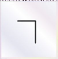
10 Stück Silikon

- als stirnseitigen Abschluss der Rahmenprofile Zur Sicherung der Stegplatte gegen Rutschen