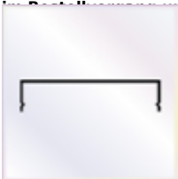
10 Stück a 3500 mm Wandanschlußprofil mit Aufkantung zum Versiegeln und Lippendichtung

OPTIONAL Alu - Abdeckprofil als passendes Klemmprofil für vorgenan. Verbindungsprofile Ausführung: weiß / braun / silber lackiert - Bitte die gewünschte Farbe im Bestellkommentar unter Bemerkung angeben.