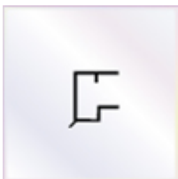
6 Stück x 0,98 m Abrutschwinkel

- einschl. des erforderlichen Tape - Bandes zum Verschließen der Stirnseite der Stegplatte. Die Tape - Bänder werden von uns gleich an die Stirnseite der Platte verklebt.