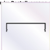
7 Stück a 2000 mm Wandanschlußprofil mit Aufkantung zum Versiegeln und Lippendichtung

OPTIONAL Alu - Abdeckprofil als passendes Klemmprofil für vorgenan. Verbindungsprofile Ausführung: weiß / braun / silber lackiert - Bitte die gewünschte Farbe im Bestellkommentar unter Bemerkung angeben.