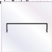
5 Stück a 7000 mm Wandanschlußprofil mit Aufkantung zum Versiegeln und Lippendichtung

OPTIONAL Alu - Abdeckprofil als passendes Klemmprofil für vorgenan. Verbindungsprofile Ausführung: weiß / braun / silber lackiert - Bitte die gewünschte Farbe im Bestellkommentar unter Bemerkung angeben.