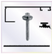
2 Stück a 7000 mm Alu - U - Profil

- einschl. des erforderlichen Tape - Bandes zum Verschließen der Stirnseite der Stegplatte. Die Tape - Bänder werden von uns gleich an die Stirnseite der Platte verklebt.