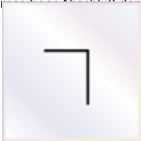
5 Stück Silikon

- als stirnseitigen Abschluss der Rahmenprofile Zur Sicherung der Stegplatte gegen Rutschen